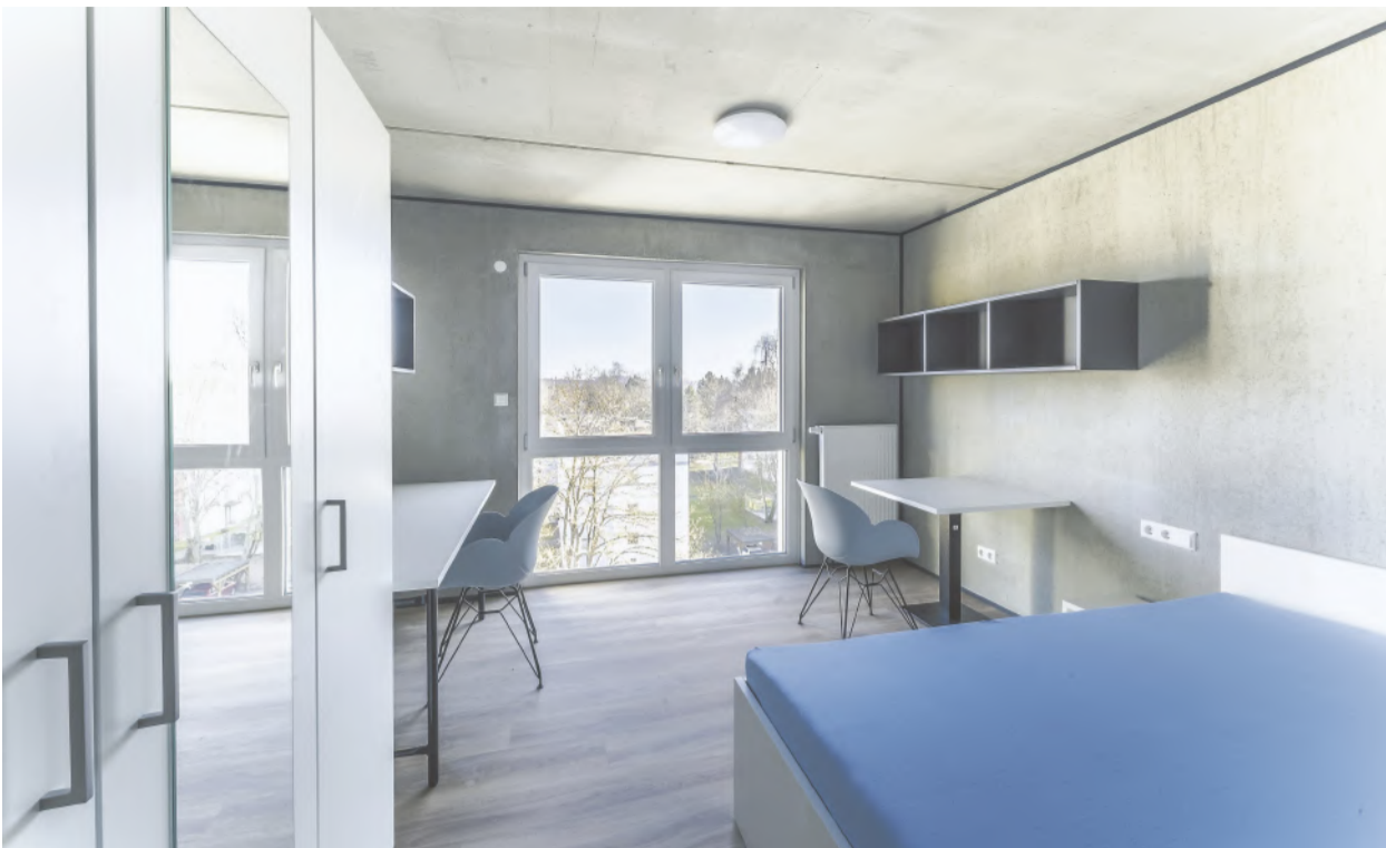
Zwischen 21 und 36 Quadratmetern sind die 163 Mikroapartments groß und bieten eine komplette Möblierung. Die Mieter können also direkt einziehen und sich wohlfühlen.