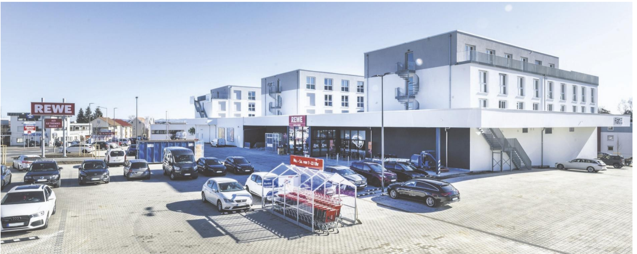
Auf dem rund 12 600 Quadratmeter großen Gelände der Alten Ziegelei sieht es nun vollkommen anders aus: Blickfang ist ein neues Gebäude, das Mikrowohnungen und einen Rewe-Markt samt Bäckerei beinhaltet.