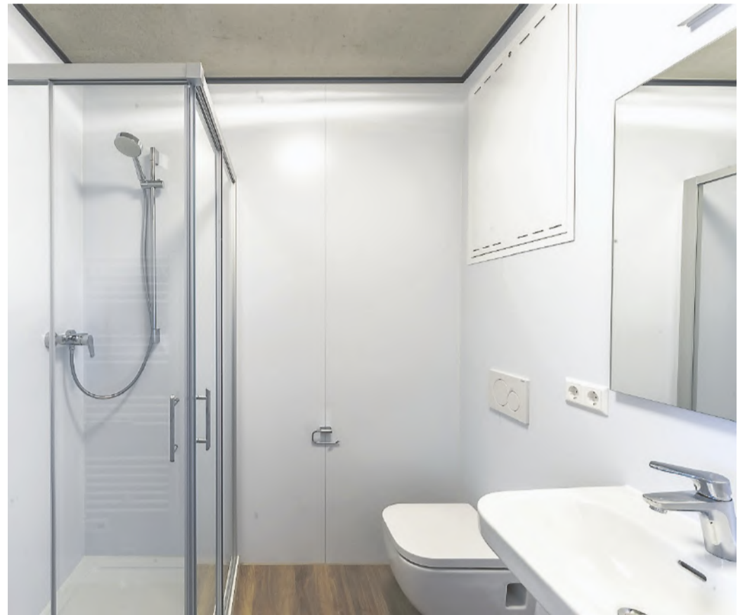
Zur Ausstattung gehören auch eine vollwertige Küche ohne Abstriche sowie ein Bad mit Duschkabine, Toilette und Waschbecken. Im Keller stehen zusätzlich Waschmaschinen sowie Trockner bereit.