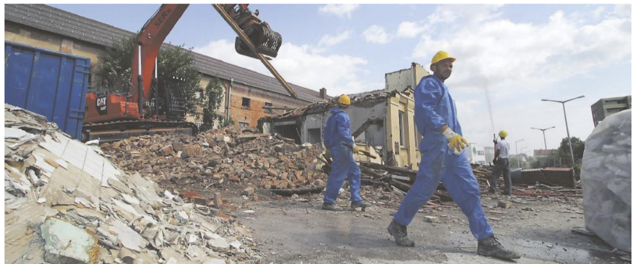
Beim Bau wurde auf Nachhaltigkeit Wert gelegt. So ist das Gebäude nach dem KfW-40-Standard erbaut, verfügt über eine Pelletheizung sowie eine Photovoltaikanlage, die Wohnungen und Rewe mit Strom versorgen. Baubeginn war im Herbst 2020, nachdem 2017 umfassende Abrissarbeiten durch die SER GmbH aus Heilbronn auf dem Gelände stattgefunden hatten.