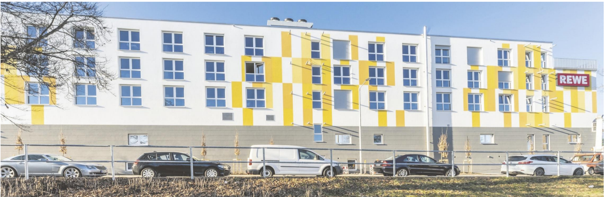
Das fünfstöckige Gebäude verfügt über eine Tiefgarage mit 84 Stellplätzen für die Bewohner der 163 Mikroapartments. Nur noch wenige Wohnungen sind verfügbar.