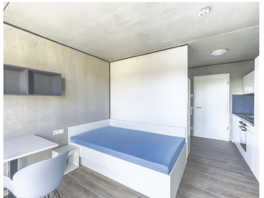
Mikrowohnungen sind der neue Wohntrend. So sollen vor allem Studierende und Auszubildende günstig wohnen.

Millionen Euro teuer war das Großprojekt auf dem Gelände der Alten Ziegelei, das nicht nur 163 Mikroapartments, sondern auch einen Nahversorger beinhaltet.